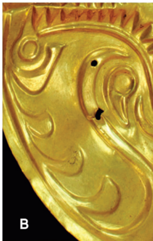
▼ (120b) Cresta-ave / Crest-bird.