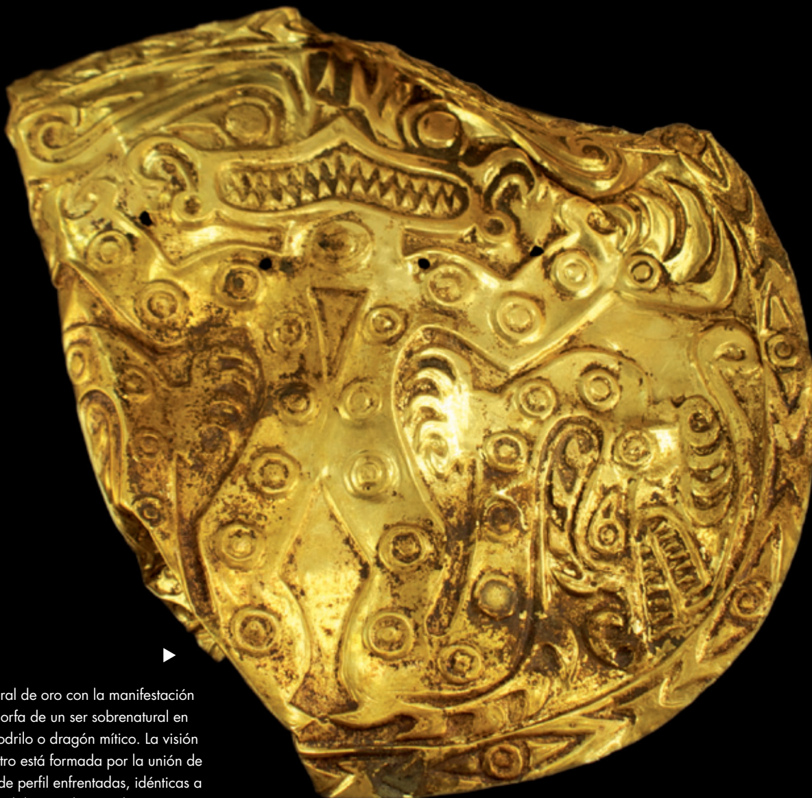
(121a) Pectoral de oro con la manifestación antro-po-zoomorfa de un ser sobrenatural en forma de cocodrilo o dragón mítico. La visión frontal del rostro está formada por la unión de dos cabezas de perfil enfrentadas, idénticas a los de los cocodrilos que brotan de sus pies. En el dibujo podemos apreciar mejor cómo el diseño se organiza siguiendo un marcado eje central de simetría. La figura principal lleva en el pecho un triángulo que, opuesto por el vértice al que forma la apertura de sus extremidades inferiores, enfatiza el mensaje de desdoblamiento y dualidad que la imagen transmite. Tumba T2. Estilo Conte: 23 x 26 cm. Dibujo (121b)

Gold breastplate with the anthropomorphic-zoomorphic representation of a supernatural being in the form of a crocodile or mythical dragon. The front view of its face is formed by joining two profile heads facing each other, identical to those of the crocodiles emerging from its feet. The drawing provides a better idea of how the design is organized along a marked central axis of symmetry. The chest of the principal figure bears a triangle, the apex of which opposes the triangle formed by the opening between the lower limbs, emphasizing the deconstruction and duality of the image. Tomb T2. Conte Style: 23 x 26 cm.