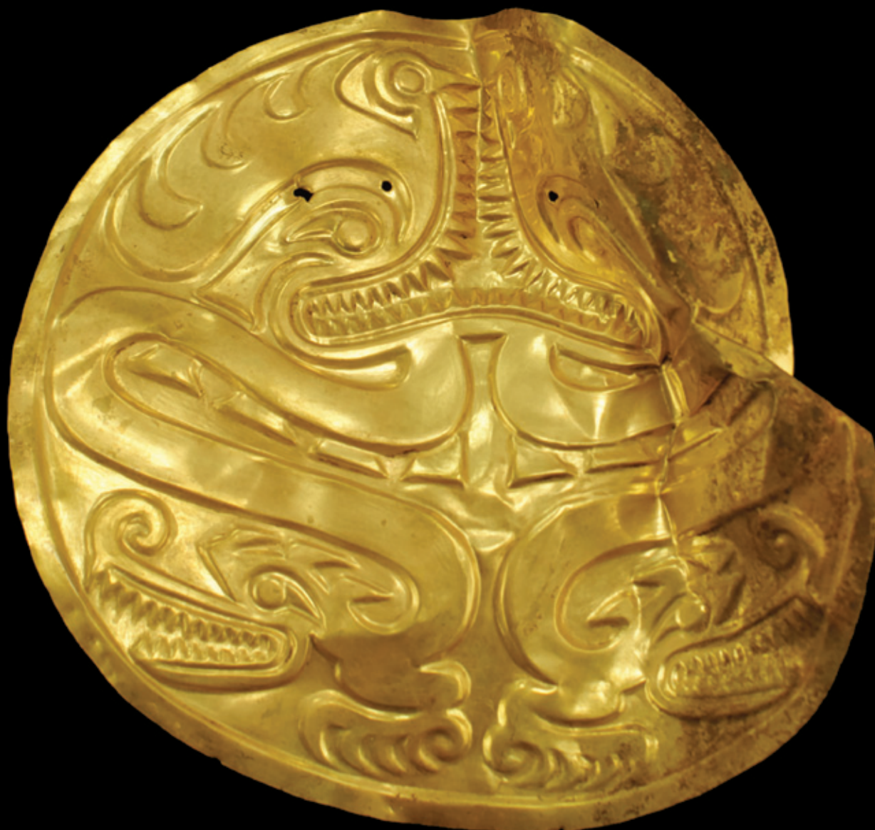
(122a) Pectoral de oro con la figura de una criatura mítica ave-reptil. Su visión frontal está formada por los cuerpos de dos cocodrilos bicéfalos de perfil, cuyas cabezas superiores al unirse por sus fauces componen su rostro. En el dibujo apreciamos mejor cómo este esconde a su vez dos aves bicéfalas en sus ojos y crestas. El último de los dientes de las mandíbulas superiores, las narices curvadas, el orificio nasal y las crestas han sido aprovechadas por el artista para figurar los picos, cabezas y alas de dos aves de perfil, una en vuelo y otra en reposo. Estilo Conte: 18 cm. Dibujo (122b)

Gold breastplate with the representation of a mythical bird-reptile hybrid. The front view is formed by the bodies of two-headed crocodiles in profile, whose upper heads joined at the jaws form the face. The drawing gives a better idea of how this in turn hides a pair of two-headed birds in the eyes and crests. The last teeth in the upper jaws, the curved noses, the nasal orifice, and the crests were used by the artist to suggest the beaks, heads, and wings of two birds in profile, one in flight and the other at rest. Conte Style: 18 cm.