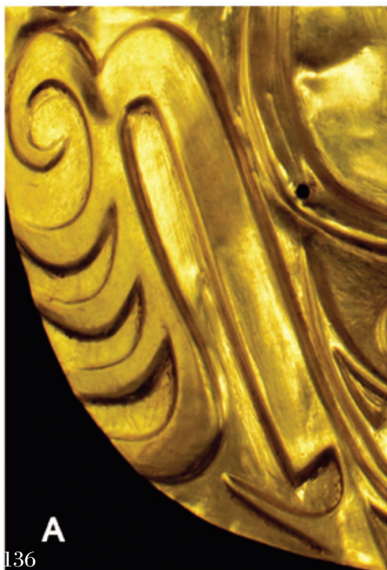
▼ (120a) Cresta-garra / Crest-claw.