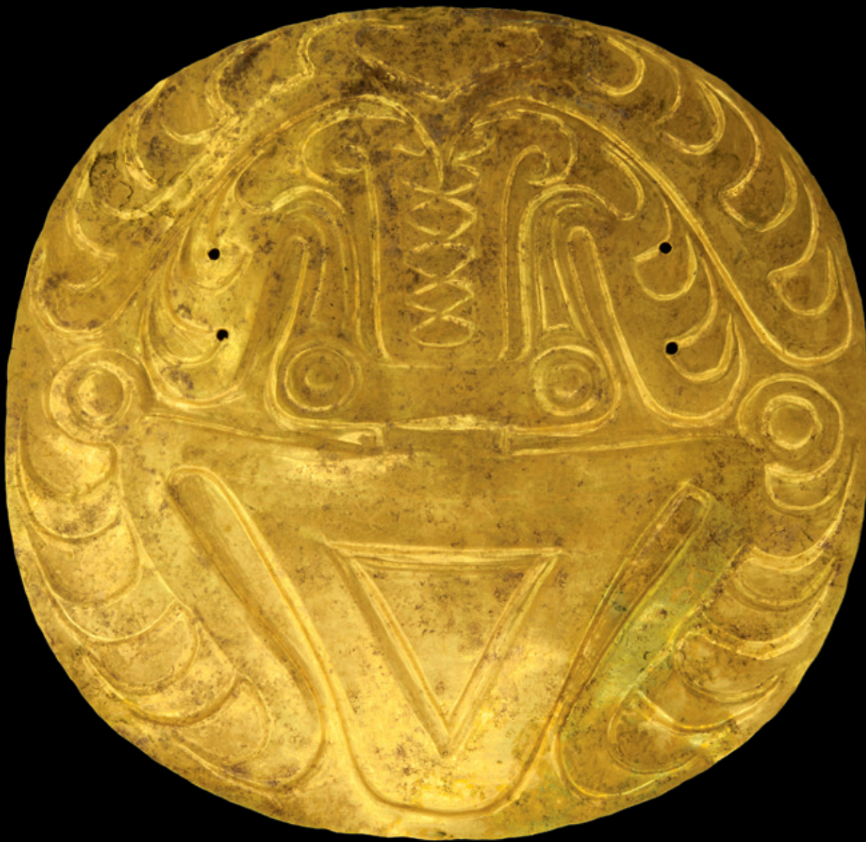
(131) Pectoral circular de oro martillado y repujado con la figura de un calamar volador en Estilo Conte. La evolución estilística complica la identificación de la imagen, que aquí tiene la cabeza desdoblada, las aletas desplegadas y los brazos y ventosas sustituidos por crestas, lenguas y plumas. (Dimensiones: 18,5 x 19 cm).

Round breastplate of hammered gold alloy with a repoussé design of a flying squid in the Conte Style. Stylistic changes complicate identification of an image that has a deconstructed head, unfurled fins, and crests, tongues, and feathers instead of suckers. (Size: 18.5 x 19 cm).