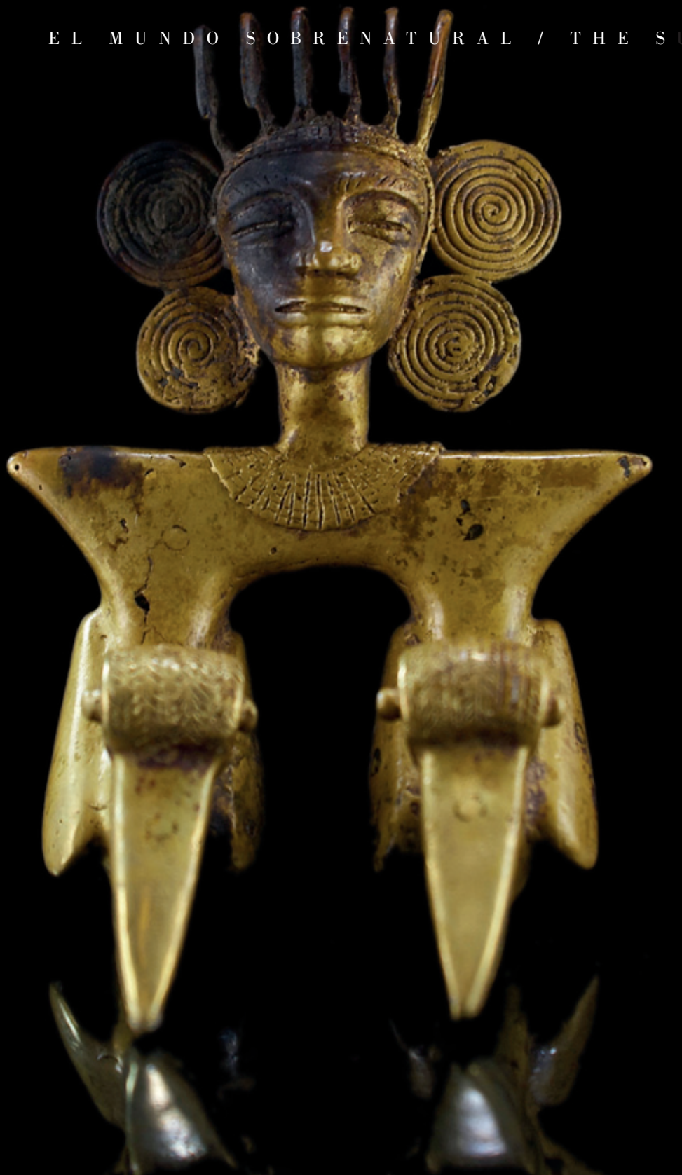
▲ (123) Pendiente de oro, elaborado con el método de la cera perdida, perteneciente al ajuar del individuo principal de la Tumba T2. La imagen permite una doble lectura según el ángulo de visión. Aquí vemos un personaje sentado cuyo cuerpo, con la excepción de cuello y cabeza, ha sido sustituido por dos aves gemelas. Estilo Internacional: 12 cm.

This gold pendant, made by the lost wax casting method, formed part of the grave goods of the principal individual in Tomb T2. The image lends itself to a dual reading depending on the angle from which it is viewed. Here we see a seated person whose body, except for the head and neck, has been replaced with twin birds. International Style: 12 cm.